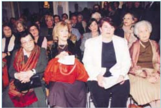
Γενική άποψη της αίθουσας.