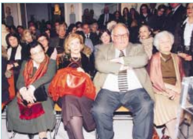
Γενική άποψη της αίθουσας.

για την ελευθερία, για την προάσπιση των ελευθεριών του ανθρώπου, της σκέψης και της ακεραιότητας και ιδιαίτερα να το αφιερώσω στην Ηλέκτρα Αποστόλου, τη γυναίκα που εκτελέστηκε έτσι. Δεν είναι για την Ηλέκτρα Αποστόλου σαν άτομο, που έχω τη διάθεση αυτή, η Ηλέκτρα έζησε και πολέμησε, αγωνίστηκε σε μία δύσκολη εποχή και σε ένα χώρο που ήταν πολιτικά και ιδεολογικά για την Εθνική Ανεξαρτησία, αλλιώς όχι μόνο γι' αυτήν, και την κοινωνική ανεξαρτησία και χειραφέτηση. Επομένως, και την χειραφέτηση των γυναικών, αλλιώς σε μία συζήτηση που είχα λίγες μέρες πριν φύγω με μία συνάδελφο στο Παρίσι, τι τη θέλεις τη χειραφέτηση και την ελευθερία, αν σου λείπει η μόρφωση; Δηλαδή, η μόρφωση των γυναικών πρέπει να πηγαίνει παράλληλα. Φυσικά, και γι' αυτό ο Σύνδεσμος των Ελληνίδων Επιστημόνων έχει μία βαρύτητα και εύχομαι να αποκτήσει πολλή μεγαλύτερη βαρύτητα. Γιατί την ύπαρξή του δεν νομίζω ότι έχει αρκετά εκτιμηθεί το γεγονός ότι αυτός ο Σύνδεσμος υπάρχει, και πώς πρέπει να βοηθηθεί και πώς πρέπει να ανοίξει παραπάνω τις δυνατότητές του για δράση. Γιατί θεωρώ ότι ο Σύνδεσμος αυτός μπορεί θαυμάσια, ακόμη σιγά-σιγά να αρχίσει να έχει και προγράμματα έρευνας, και προγράμματα μελετών.