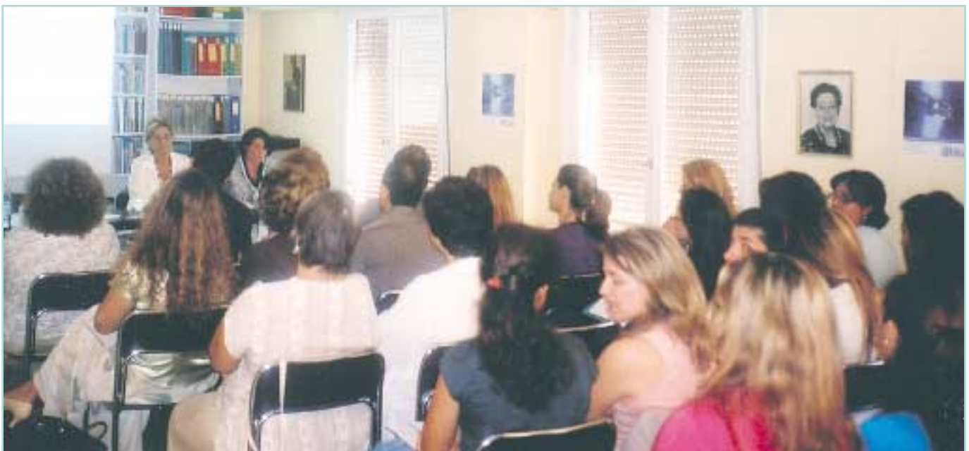
Γενική άποψη της αίθουσας.

Σε μια εποχή που η κυρίαρχη ιδεολογία και τα ΜΜΕ προβάλλουν ως πρότυπα τα μοντέλα, τις ηθοποιούς, τις τραγουδίστριες και γενικότερα τις γυναίκες που πετυχαίνουν στην καριέρα τους χρησιμοποιώντας τα "γυναικεία" τους προσόντα, ο ΣΕΕ προβάλλει, μέσα από το έργο αυτό, σαν πρότυπα τη Μαρία Κιουρί και την Αμαλία Φλέμιγκ, αλλά και την απλή ανώνυμη ερευνήτρια, διδάκτορα και καθηγήτρια, η οποία αγωνίζεται για την καριέρα της με όλη τη σκληρή δουλειά και την επιστημονική επάρκεια. Και το μήνυμα που δίνει στις νέες επιστημότισσες είναι ότι η επιστημονική γνώση και η εμπέδυσή σε αυτήν είναι ανεπανάληπτη προσωπική εμπειρία, η οποία έχει ως αποτέλεσμα όχι μόνον έναν καλύτερο τίτλο σπουδών, εφόδιο για μια καλύτερη καριέρα, αλλά την αυτογνωσία και το πέρασμα σε μια άλλη πνευματική διάσταση, εφόδιο για μια ουσιαστική, περιεκτική και ολοκληρωμένη ζωή.