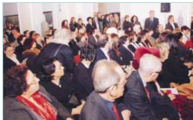
Γενική άποψη της αίθουσας.

Πρώτος συμβολισμός, η Υπατία: Η Υπατία γεννήθηκε και έζησε στην Αλεξάνδρεια από το 370 ως το 415 μ.Χ. Ήταν θυγατέρα του φιλοσόφου και μαθηματικού Θέωνα, διευθυντή του Μουσείου (βιβλιοθήκης του Πανεπιστημίου) της Αλεξάνδρειας. Ως εκ τούτου, απέκτησε σπάνια μόρφωση, σε μια εποχή που η θέση της γυναίκας στην κοινωνία ήταν πολύ διαφορετική από την σημερινή. Το 392 μ.Χ. ήρθε για σπουδές στην Αθήνα και εντυπωσιάσε με το πνεύμα, τη σεμνότητα, την ομορφιά και την ευγλωττία της. Πολύ σύντομα αναδείχθηκε σε μεγάλη μορφή στα μαθηματικά και τη φιλοσοφία. Μετά την επιστροφή της στη γενέθλια πόλη, δίδαξε μαθηματικά, αστρονομία, φιλοσοφία και μηχανική στην Ανώτατη Σχολή της Αλεξάνδρειας, ενώ παράλληλα διέδιδε τις αρχές του Πλάτωνα και του Αριστοτέλη. Η ξεχωριστή της παιδεία την έκανε να υπερτερεί όλων των