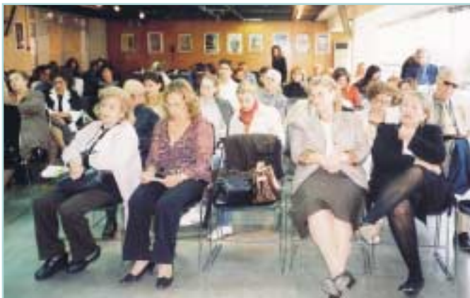
Γενική άποψη της αίθουσας.

Η εξαιρετική πρωτοβουλία του Συνδέσμου Ελληνίδων Επιστημόνων να αναδείξει την σημασία της εκπαίδευσης στην διαμόρφωση της φεμινιστικής συνείδησης με την διοργάνωση πέραν των άθλων και της σημερινής ημερίδας, προσδιορίζει για μια ακόμα φορά τις ανησυχίες της Διοίκησης και των μελών του, αθλή και την ευρύτητα της δράσης και της θεματολογίας του. Ως εκπρόσωπος του Τομέα Γυναικών του ΠΑΣΟΚ, θα ήθελα να χαιρετίσω την σημερινή ημερίδα, να συγχαρώ για τον πλούτο και την εγκυρότητα των εισηγήσε-